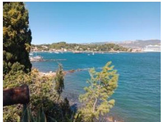
Fort de l'Eguillette