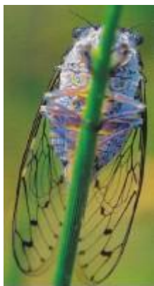
Tsitsitsi...la cigale !