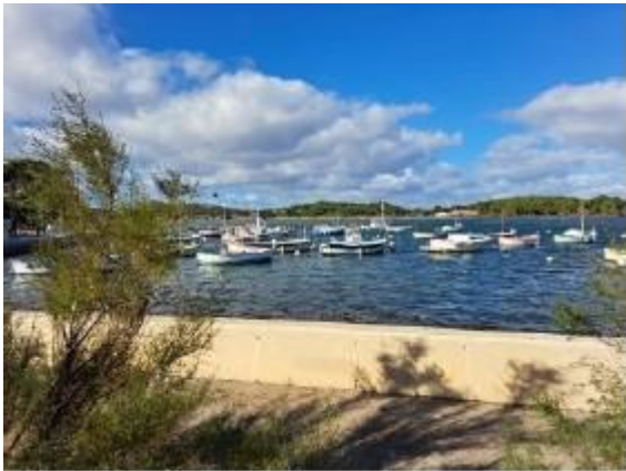
La lagune du Brusc Rade de Toulon, Des bleus aux verts, vous y découvrirez une palette de couleurs incroyable.

La nature est belle dans tout le département du Var ; on a choisi de vous faire connaître un tout petit coin du Var-Ouest, dans un périmètre limité entre Le Castellet médiéval, Bandol et Sanary-sur-mer, Toulon, Six-Fours-les-Plages et Le Brusc, La Seyne-sur-mer et Les Sablettes, le port St Elme, la forêt de Janas.