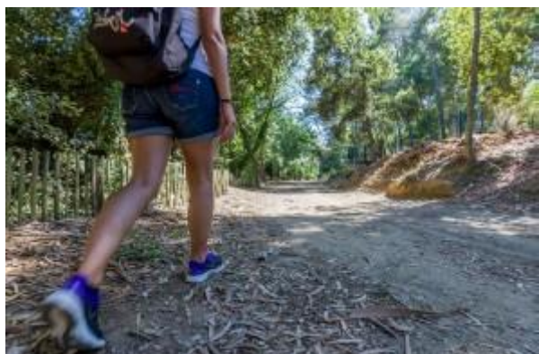
Forêt de Janas